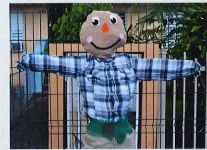
Espantapájaros creado por los niños durante los talleres.

“Así como vienen los niños vienen los adultos y todos juntos compartimos ahí. Es como un lugar de armonía para todos nosotros”.