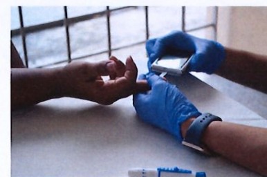
Enfermera tomando pruebas de glucosa.