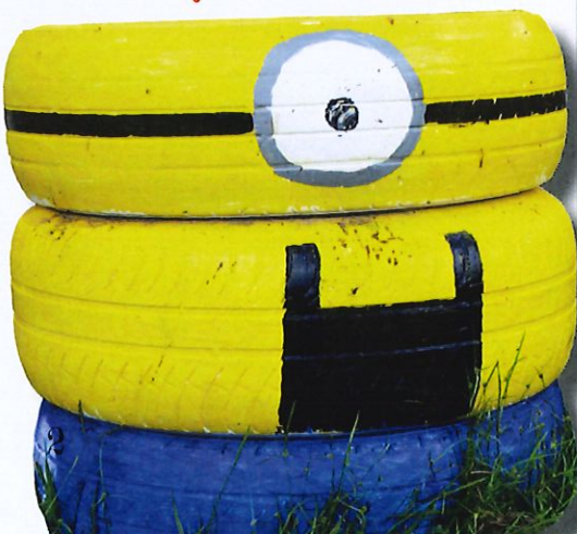
Gomas recicladas pintadas por los niños para ser utilizadas como sistemas alternos de siembra.