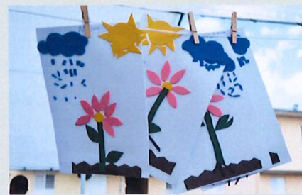
Algunos de los trabajos realizados por los niños en la actividad “Partes de una Flor”.