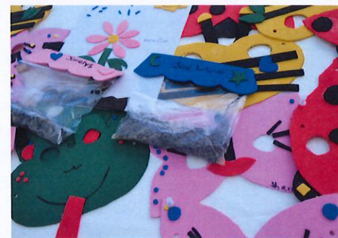
Máscaras creadas por los niños en la actividad “Animales Amigos del Huerto”

Los niños tuvieron oportunidad de recibir talleres sobre composta, reciclaje, control de plagas, organismos y agroecología, entre otros. Con el conocimiento adquirido también aprendieron a hacer un espantapájaros para el huerto como método de control de plagas, aprendieron a identificar las partes de una flor, presenciaron y trabajaron en la creación de composta, aprendieron sobre los distintos tipos de semillas que existen y conocieron parte de los animales que promueven el desarrollo y mantenimiento del huerto, de los cuales creció imaginación para la creación de máscaras que luego utilizaron para su diversión.